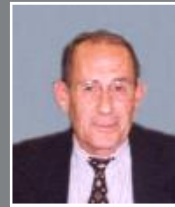
Vice-Président Commission n°1 : développement économique, emploi, TIC, tourisme.

Aussi, je vous invite à nous faire connaître votre point de vue en venant nombreux lors des réunions de concertation qui se dérouleront en novembre prochain.