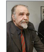
Vice-Président Commission n°3 : habitat, déplacements, infrastructures, urbanisme, démographie, patrimoine architectural et urbain.

Enfin, le rééquilibrage de l'offre commerciale est aussi l'un des objectifs du Projet d'Aménagement et de Développement Durable : il s'agit, sans écarter les projets créateurs d'emploi, de maîtriser le développement des équipements commerciaux périphériques tout en renforçant le commerce de centre-ville et de proximité, ceci afin de maintenir une animation économique dans le centre-bourg comme dans les pôles urbains et de permettre à tous l'accès au commerce.