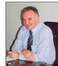
Vice-Président Commission n°2 : protection de l'environnement, espaces ruraux, cadre de vie, agriculture.