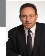
Vice-Président Commission n°4 : Vie sociale, santé, enseignement, sport, culture, loisirs.

Une amélioration de l'ensemble des échanges, quel que soit le mode de transport, permettra néanmoins de développer l'accessibilité de notre arrondissement, élément essentiel du renforcement de son attractivité.